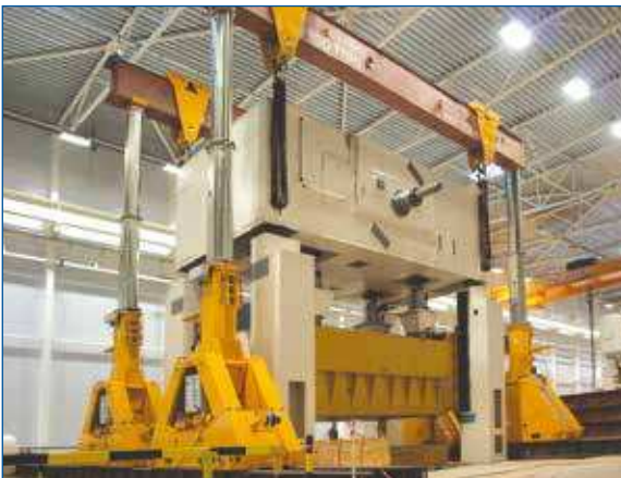
◀ SBL-1100-Serie, Hydraulischer Portalkran.