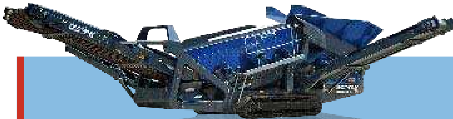
Widok z boku MS 15 Z Pozycja transportowa