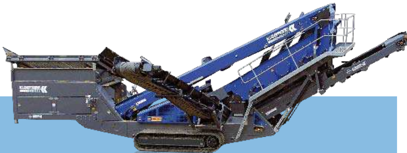
Widok z boku MS 16 Z Pozycja transportowa