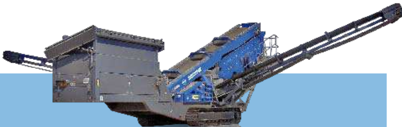
Widok z boku MS 19 D Pozycja transportowa