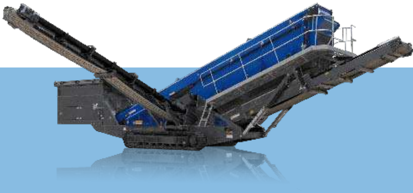
Widok z boku MS 19 Z Pozycja transportowa