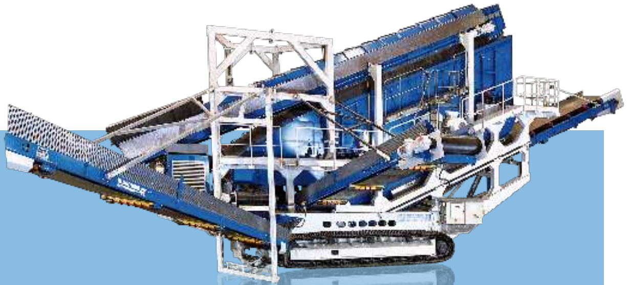
Widok z boku MS 23 D