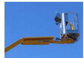
Fly jib (option)