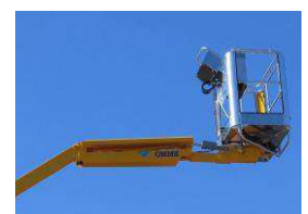
Fly jib (option)