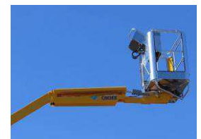
Fly jib (option)