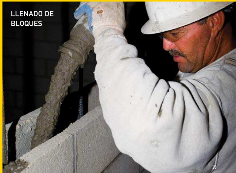
LLENADO DE BLOQUES