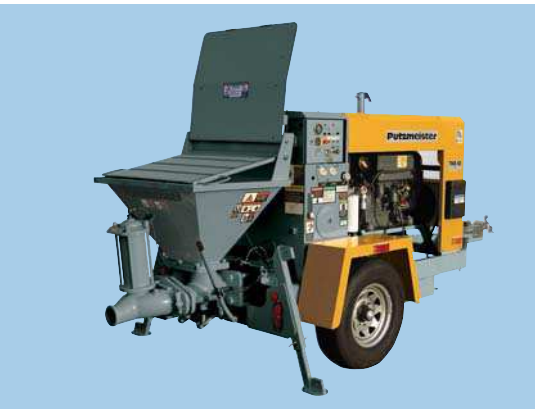
Serie TKB Bombas hidráulicas de válvula de bola