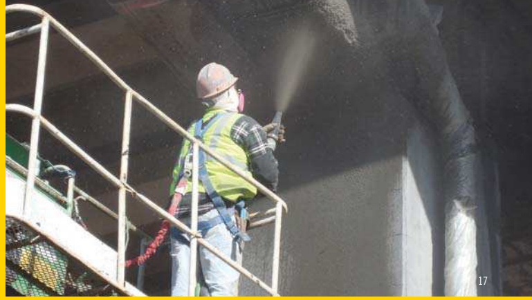
REPARACIÓN DE PUENTES