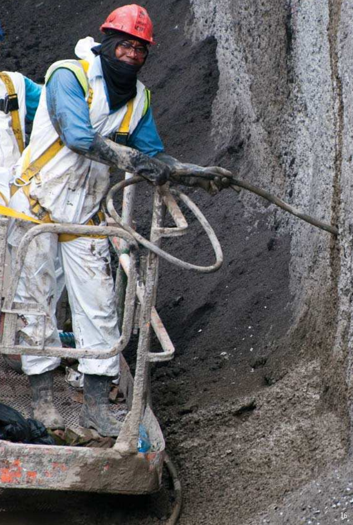
LECHADA DE COMPACTACIÓN