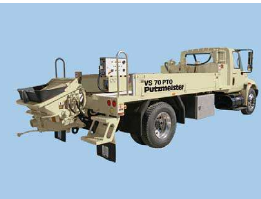
Serie VS • Montada en vehículo

Consulte la hoja de especificaciones que está aparte.