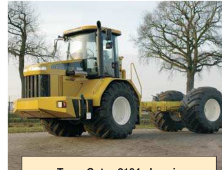
Terra-Gator 2104 chassis

Reeds meer dan 10 jaar uw specialist voor multifunctionele toepassingen