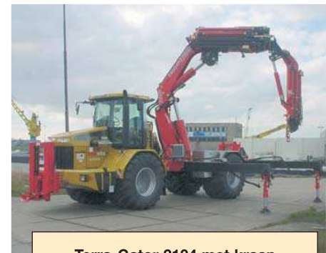
Terra-Gator 2104 met kraan