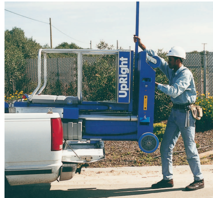
所有型号均配有装载机构，能协助人员装上卡车