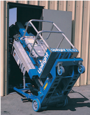
向后翻转架允许所有型号通过标准门道。大直径的后轮及滚动轴承能容易地越过障碍。

产品技术规范随时会更新，恕不另行通知。本册中的照片及图标仅用于宣传目的。有关正确使用和维护的详细说明，请参见操作手册。