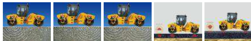
前轮振动 后轮振动 前后同时轮振动 低频高幅，厚沥青层压实 高频低幅，薄沥青层压实

双频双幅适应不同厚度铺层的压实；配置分振功能，有效压实铺层接缝等。均压技术的应用大大改善了压实质量，提高了压实均匀性。